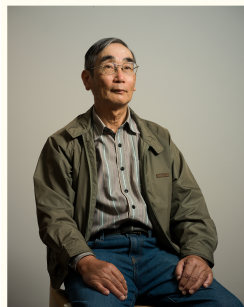
ポートレート展「つくるひと」