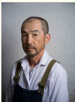
ポートレート展「つくるひと」